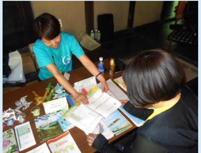
「ルミナリエセレモニー」