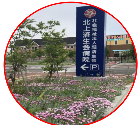
病院入口になでしこが咲きほころびます

この歌にちなんで、いつの世にもその趣旨を忘れないようにと、撫子の花葉に露をあしらったものを、大正元年以来、済生会の紋章としています。