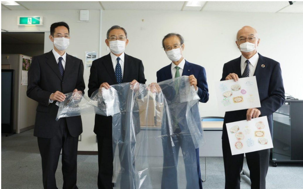
【宮内庁職員（左2人）から届けられたガウンとメッセージ】