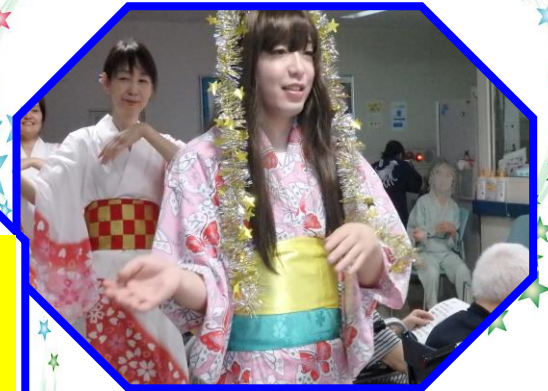
おりひメ 織り姫 登場！